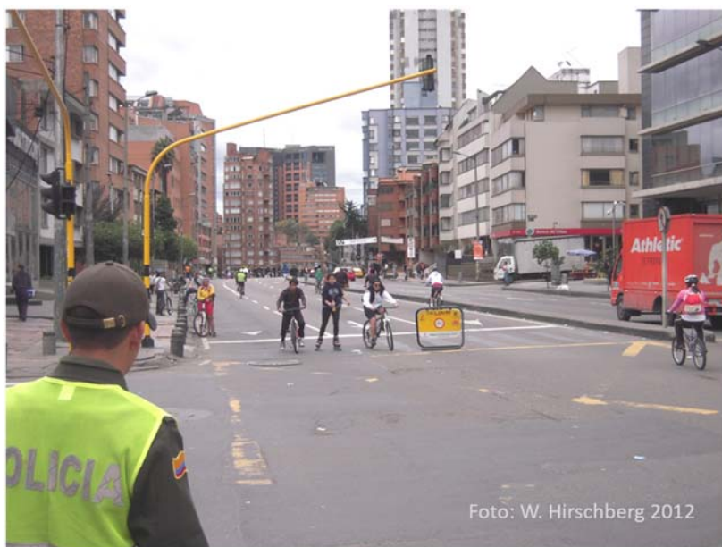
Bogotá, Kolumbien, ca. 11 Mio Einwohner: Am Sonntag gehören die Straßen den Menschen und nicht den Autos

Die abschließende lebhafteste Diskussion, in der viele Fragen und Kommentare vorgebracht werden, zeigte das große Interesse des Auditoriums an den angesprochenen Mobilitätsthemen. Insbesondere war man sich weitgehend einig, dass es im Sinne einer Verbesserung der Verkehrssituation nicht einer Technologiewende, sondern einer Verkehrswende bedarf.